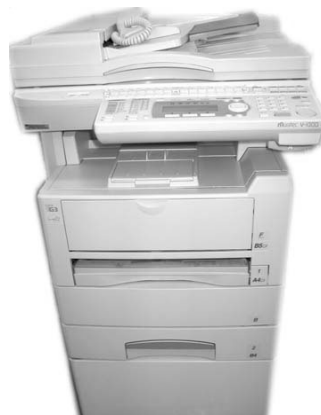
③Muratec V-1000 4段カセット コピー&FAX 毎分18枚 ¥158,000