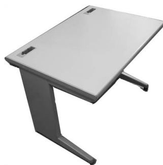
⑥平机 1000×700×700 ¥8,800