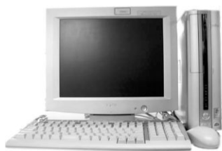
⑤FUJITSUパソコン FMV-Deskpower CE8/85L CPU : Duron-850Mhz メモリー : 128MB HDD : 40GB *CD、CD-RW、FD、DVD搭載 *15インチ液晶ディスプレイセット ¥42,800