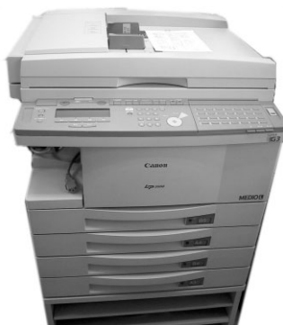
①Canon LP-3000 4段カセット ¥128,000 (プリンター付は+30,000円)