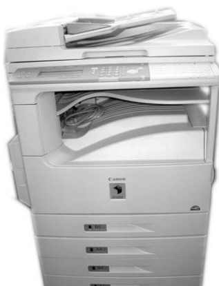
②Canon IR1600 4段カセット コピー&FAX 毎分16枚 ¥220,000