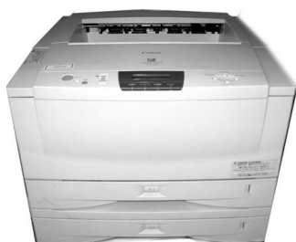
④Canon LBP-1810 (レーザープリンター) 2段カセット/LAN/ パラレル対応 ¥55,000