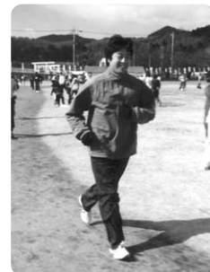
日高かわせみマラソンにて!

私たちと出会った企業様のできるだけ多くがホームページを使ったビジネスの可能性を感じていただき、そして、そこから利益を生み出せるよう私たちも努力していきます。